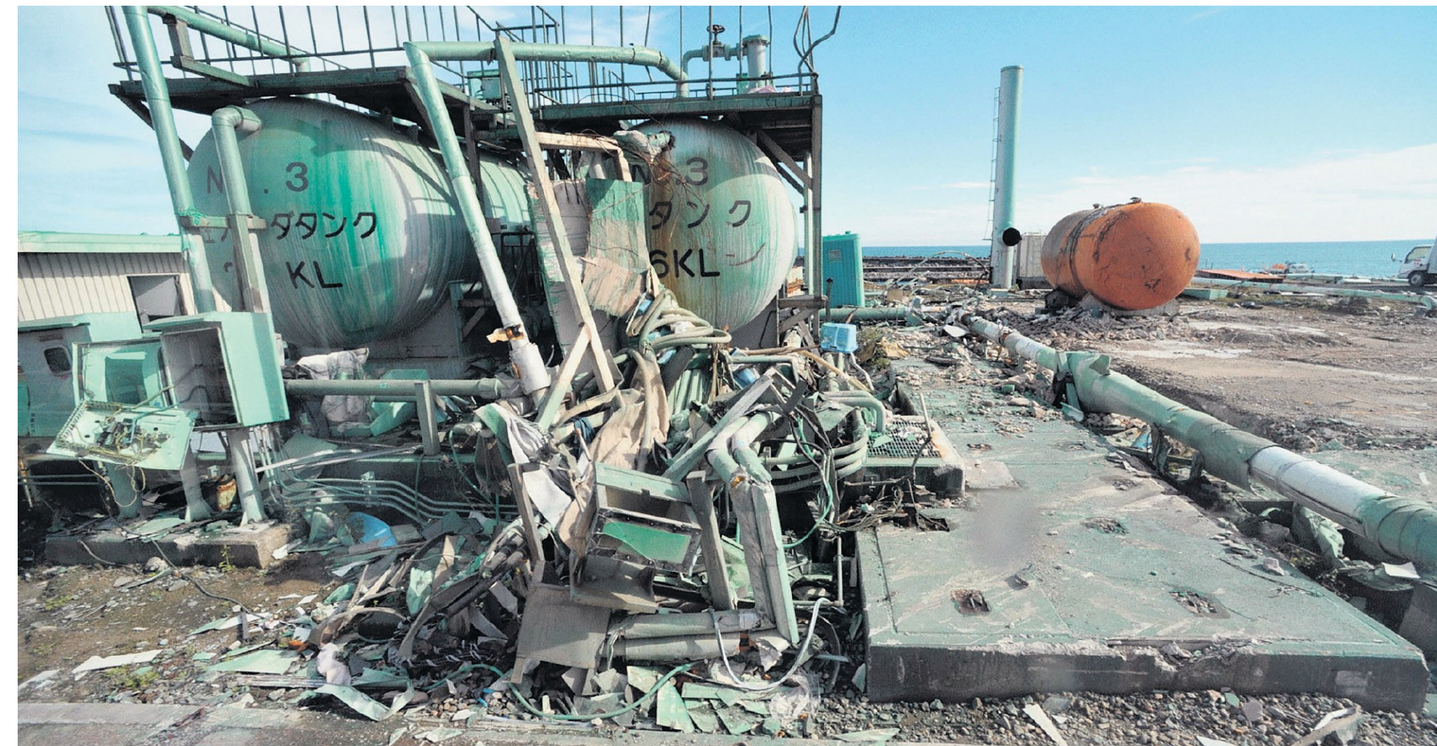
De ramp met de kerncentrale Fukushima in Japan is een van de redenen dat Delta de start van de vergunningsprocedure voor de bouw van een nieuwe kerncentrale uitstelt.